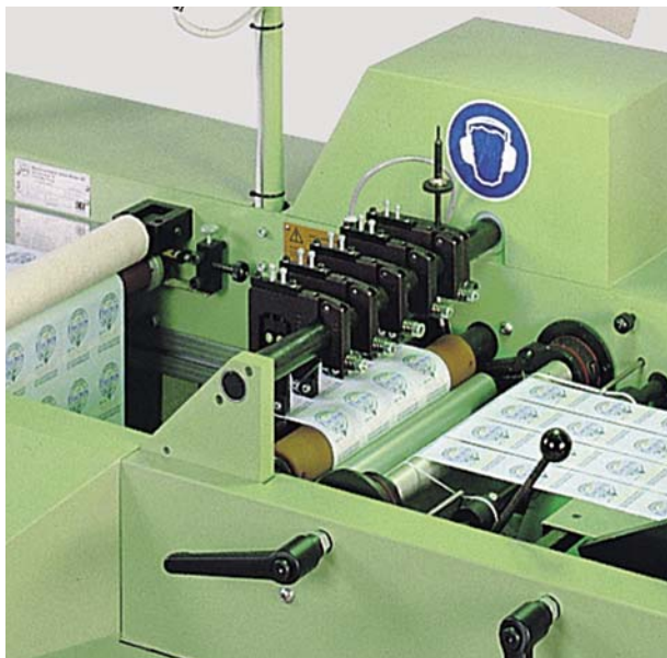
Schneidbalken ohne seitliche Verstellung

Die Nachrüstung ist einfach und kann vom Kunden mit Hilfe der ausführlichen mitgelieferten Anleitung selbst ausgeführt werden.