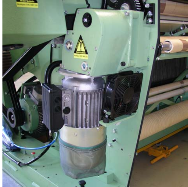
VARIPICK – 变频器控制，3 相马达