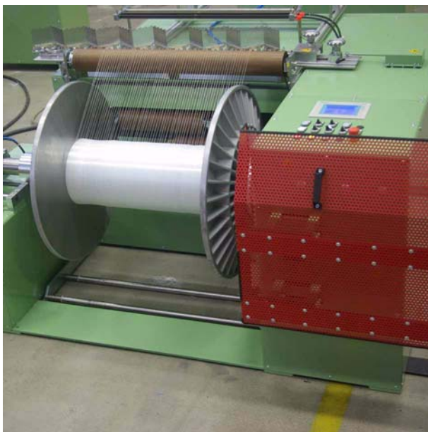
Carrete y peine de expansión

Esta opción permite desplazar el cabezal de urdido a otra fileta, permitiendo así cubrir ambos campos