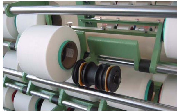
soporte de bobina abatible

Gracias a los eficientes accionamientos, cuando ocurre una rotura de hilo, el equipo se para de inmediato. Ésto impide que el hilo roto se enrolle alrededor del plegador. La secuencia de frenado se inicia en un parahilos montado en la salida de la fileta, indicando el lugar del hilo roto mediante una señal óptica, por lo tanto garantiza que la rotura de hilo pueda ser corregida de inmediato, sin largas búsquedas de su localización, y reduciendo el paro de máquina a un mínimo. La construcción especialmente robusta de la fileta permite operar a velocidades hasta 450 m/min, favorecida por la precisa concentricidad del eje principal de accionamiento logrando un avance suave de los hilos. La colocación de bobinas se hace desde fuera de la fileta sobre soportes giratorios, que contribuyen a disminuir aún más los tiempos de preparación.