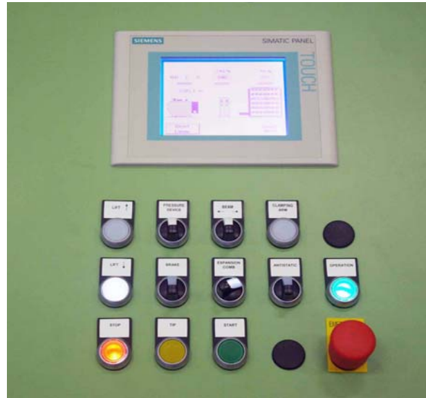
Tablero de control con pantalla táctil