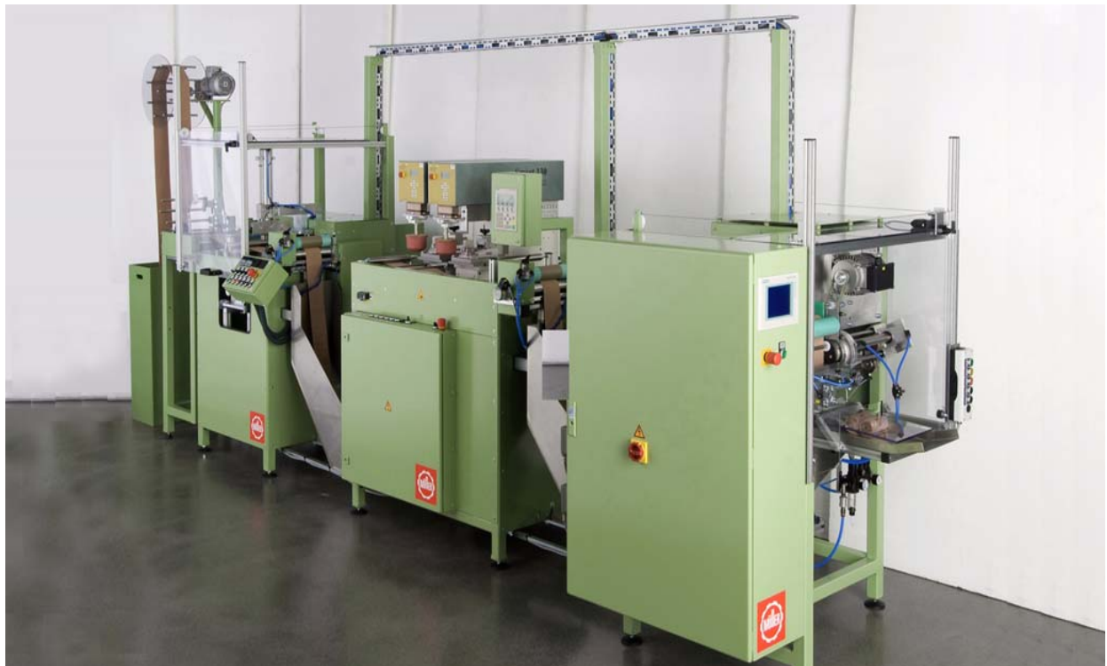
SU200 生产线 / PP2 擦除灰伤印刷机 / VWA203