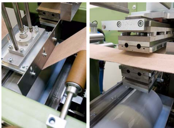
SU200 使用硅树脂带用于封边