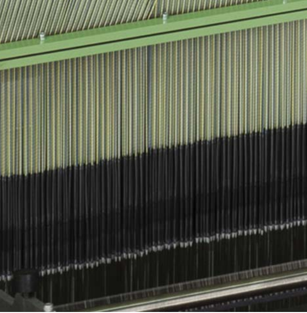
Delta bağlantıları: yeniden açılabilir, patentli plastik bağlantılar