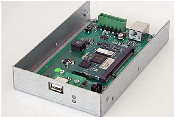
用于 UNI 控制的内部 UNI-NETWORK 接口