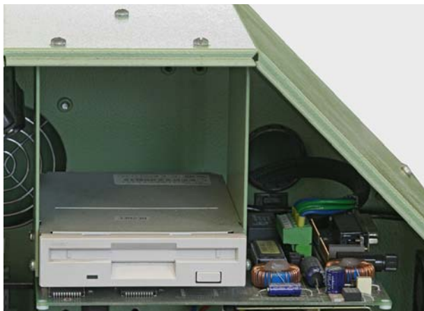
将被 UNI-NETWORK 接口替换的老装置。

MÜGRIP MBJ3, MÜGRIP MBJ3.1, MÜJET MBJL1, MVC2, NFJM2, NFJK2, V5J, V5MJ.