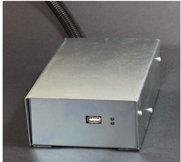
外部 UNI-NETWORK 接口用于 UNI 控制

如果机器仍使用 MÜDATA3, 必须用升级过的 EPROMS 更换成 MÜDATA4。