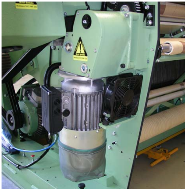
VARIPICK – 变频器控制，3 相马达